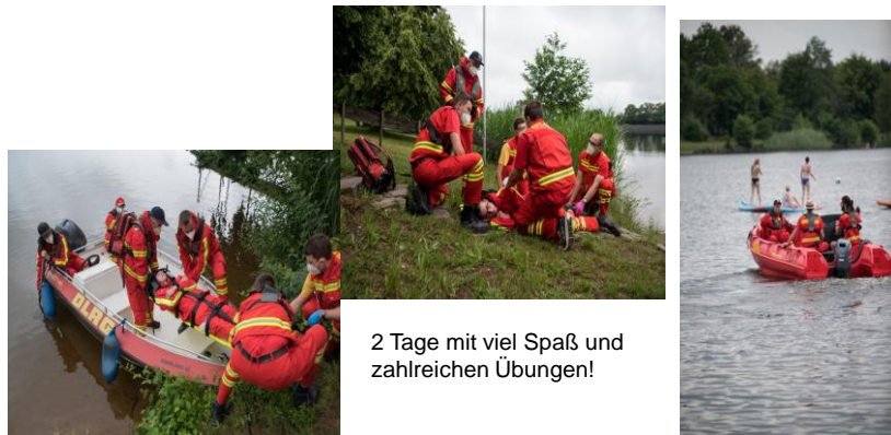
2 Tage mit viel Spaß und zahlreichen Übungen!